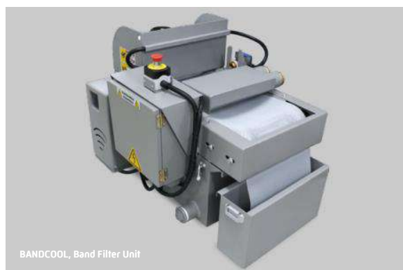
BANDCOOL, Band Filter Unit

切断室内に付着した切屑屑をシャワーで自動洗浄を行います。切断室内の錆びの発生を抑え、作業者のメンテナンスの負荷を削減します。