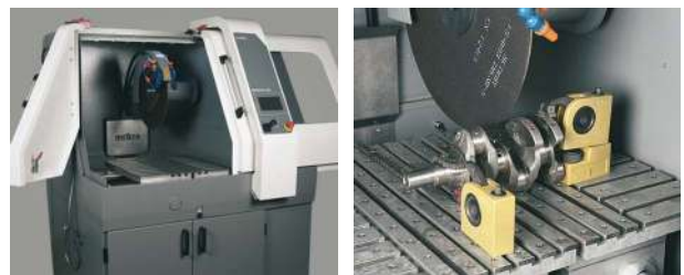
間口が広く切断室内にアクセスも簡単