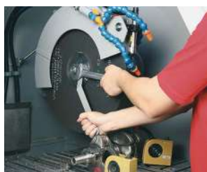
広い作業スペースで砥石交換も簡単

100種類の切断プログラムを保存できます。プログラムには試料等の名前を付けて保存が出来るので管理も簡単です。