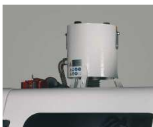
ミストフィルター

クーラントの寿命も長く出来るので、交換頻度を減らし、メンテナンスの手間も少なく出来ます。