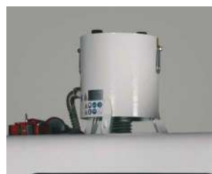
クーラントのミストを回収し快適な作業環境を作ります