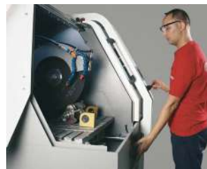
ジョイスティックで簡単操作モモモモオペレーターの安全を守る両手操作