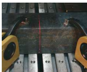
レーザー照射ユニット