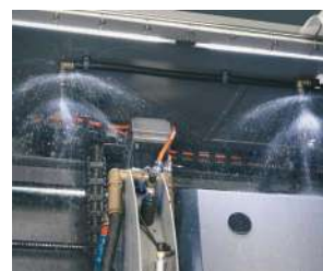
自動洗浄ユニット