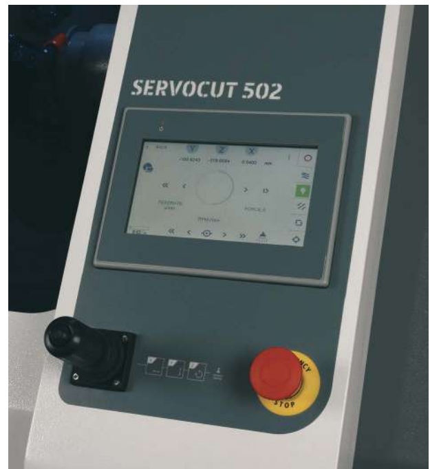
直感的で解りやすいデザインのタッチパネル