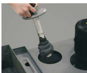
循環タンク用磁性棒

切削屑が多い試料を切断する場合は、大量の切削屑が発生します。そんな場合は、バンドクーラーをお勧めします。切削屑を自動で回収・処理するバンドフィルタ式コンベアを搭載し、115Lタンクで長時間連続使用が可能です。クーラントをろ過し、切削屑を別の容器に入れて廃棄するので環境にも優しいです。クーラントの寿命も長く出来るので、交換頻度を減らし、メンテナンスの手間も少なく出来ます。