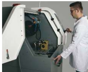
オペレーターの安全を守る両手操作