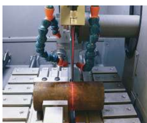
レーザー照射ユニット