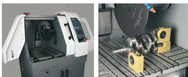
開口が広く切断室内にアクセスも簡単