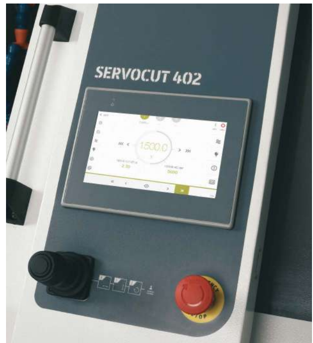
直感的で解りやすいデザインのタッチパネル

サーボカット402には、3種類の停止モードがあります。切断後の動作を指定できます。 切断終了位置停止: 切断完了位置で停止します 開始位置へ戻る: 切断開始位置に戻ります 基準位置へ戻る: 全軸リミットまで戻ります