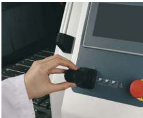
ジョイスティックで簡単操作