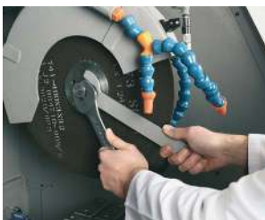
広い作業スペースで砥石交換も簡単