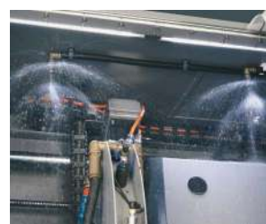
自動洗浄ユニット