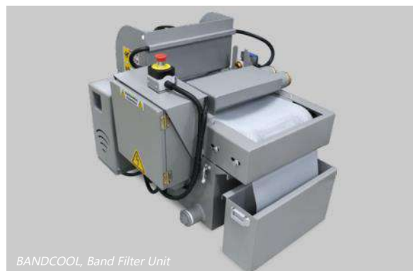
BANDCOOL, Band Filter Unit

切断室内に付着した切削屑をシャワーで自動洗浄を行います。切断室内の錆びの発生を抑え、作業者のメンテナンスの負荷を削減します。