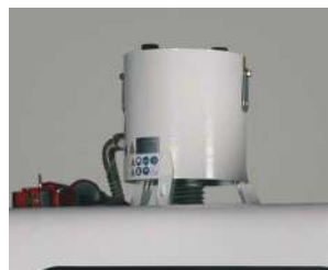
クーラントのミストを回収し快適な作業環境を作ります