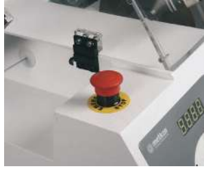
非常停止ボタンとカバーセンサ