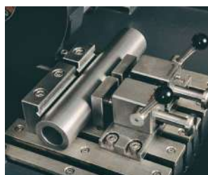
ワンタッチクランプ