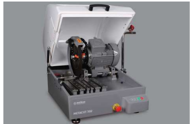
カバーが大きく開くので清掃も簡単