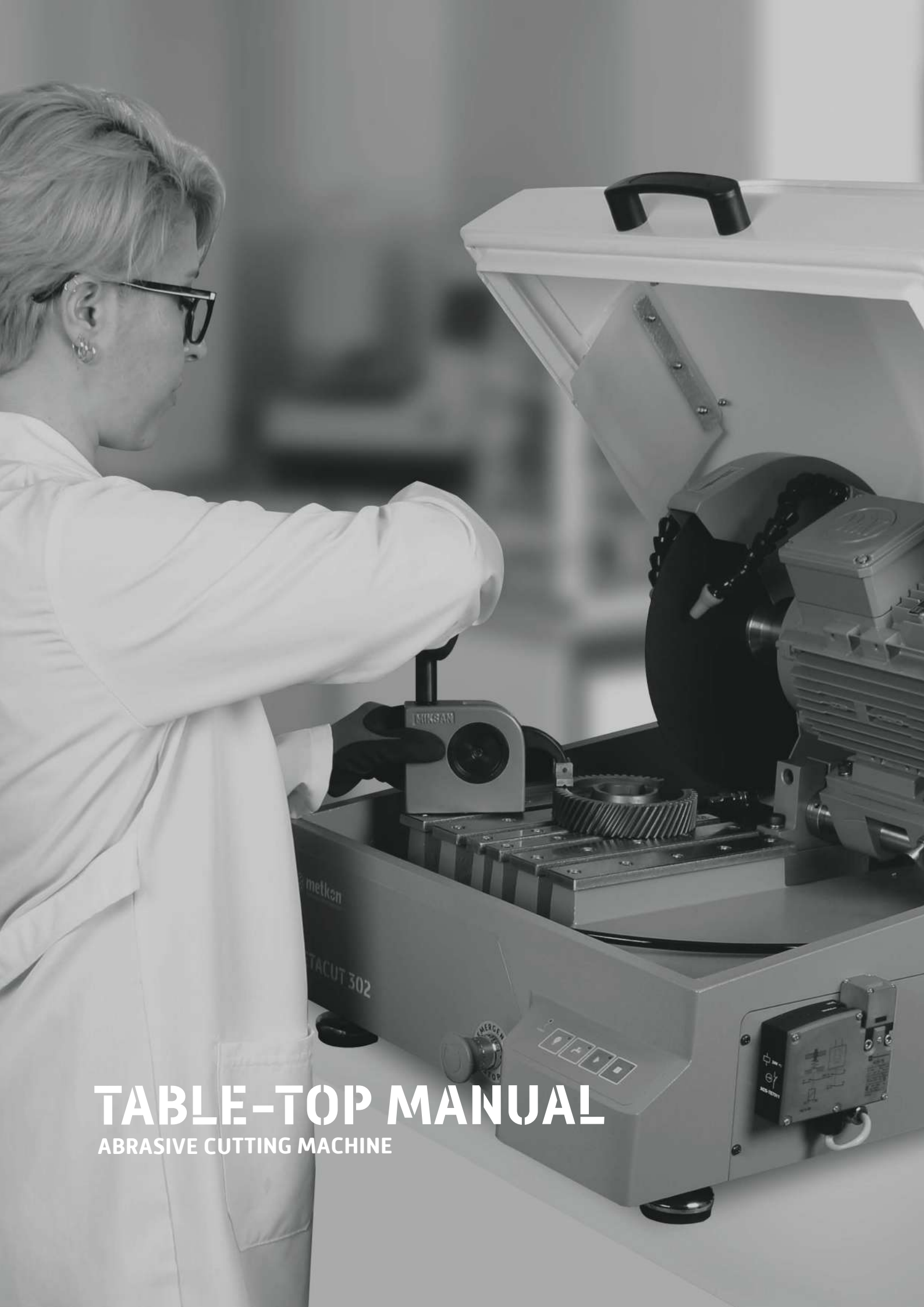
TABLE-TOP MANUAL ABRASIVE CUTTING MACHINE