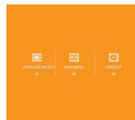
直感的で解りやすい操作性