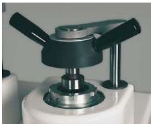
バイオネット式クロージャー